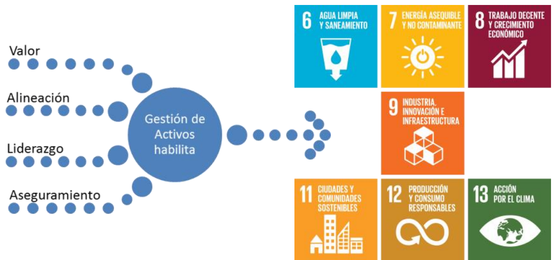
Figura 2: Facilitadores de Gestión de Activos para el logro de los Objetivos de Desarrollo Sostenible.

Una buena Gestión de Activos contribuye por naturaleza a siete de los ODS. Específicamente, la Gestión de Activos mejora la sostenibilidad de una organización al manejar efectivamente los gastos, y las actividades para lograr impactos planeados para corto y largo plazo, incluyendo la sostenibilidad de operaciones y desempeño. Los procesos de Gestión de Activos demuestran claramente la responsabilidad social y la práctica ética de negocios al mejorar la habilidad de reducir las emisiones, conservar los recursos, y adaptación al cambio climático. La Gestión de Activos también mejora la eficiencia y eficacia al revisar y mejorar procesos, procedimientos y el desempeño de los activos. La Figura 2 ilustra los fundamentos que posibilitan el éxito de una organización para lograr sus metas de RS y los resultados de ODS.